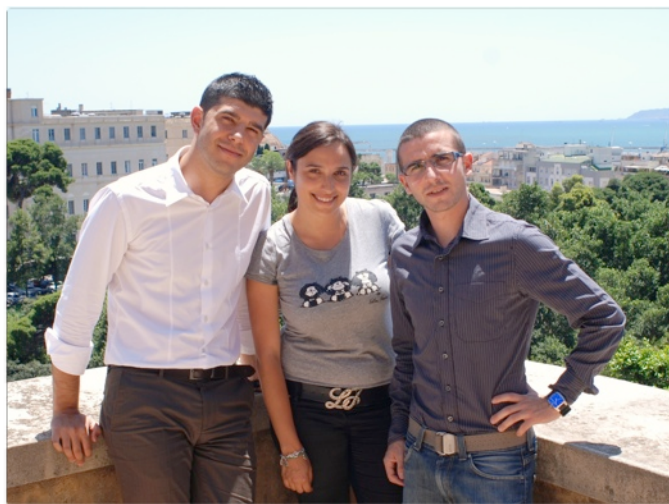
La squadra Shardana’s Fellas della Facoltà di Economia di Cagliari

Non esattamente: ci siamo avvicinati con curiosità alla materia e in più occasioni la tentazione di provarci è stata forte, ma non ce la siamo