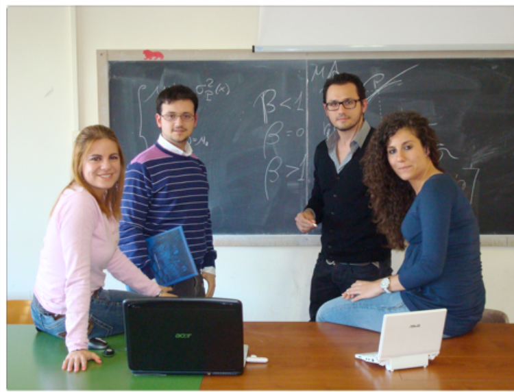
I componenti della squadra Zaisan Team della Facoltà di Economia dell'Università di Bari

Da questa esperienza ci aspettiamo di trasformare le nostre conoscenze teoriche in competenze attraverso la concreta esperienza di trading e ci auguriamo di recuperare terreno e classificarci al meglio, possibilmente in territorio positivo!